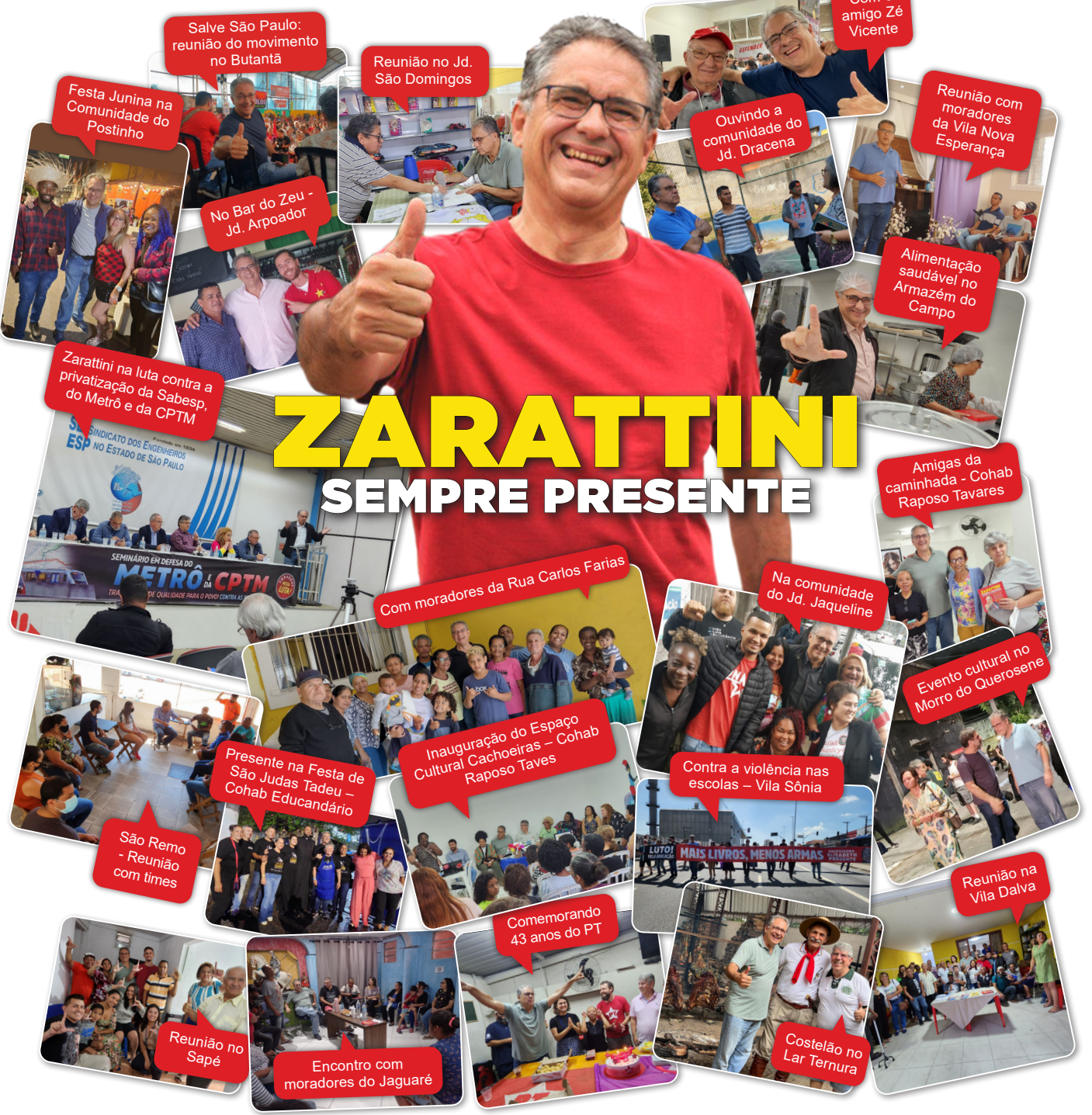
Encontro com moradores do Jaguaré