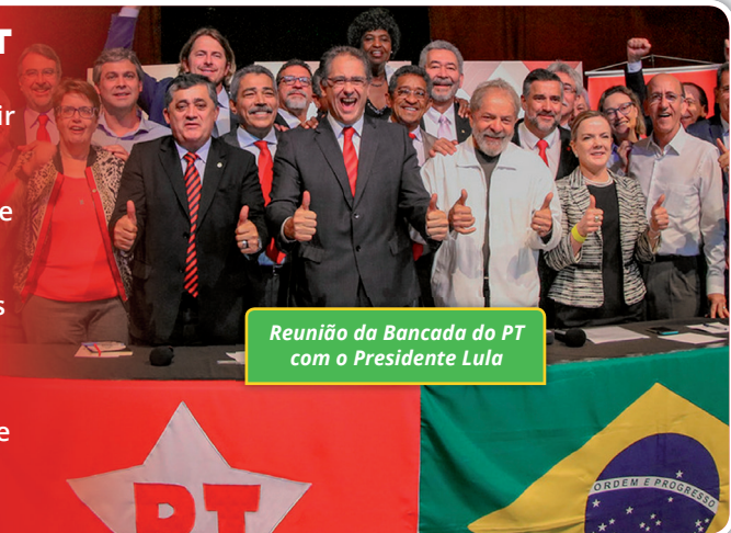
Reunião da Bancada do PT com o Presidente Lula

No governo de Bolsonaro, também participa a cúpula da Operação Lava Jato que quer prosseguir na sua intenção de fazer perseguição política a Lula, perseguição política ao PT, porque eles sabem muito bem que a maior oposição que pode surgir é a sobrevivência do PT, é sua influência sobre o povo brasileiro, é sua mobilização junto com o povo brasileiro. Por isso, fazem sucessivas condenações a Lula para tentar colocá-lo na cadeia pelo resto da vida. E vão tentar, não temos dúvidas, impedir o funcionamento do PT, porque para eles o PT é um estorvo que não pode sobreviver, porque, com certeza, vai organizar a resistência a esse governo.