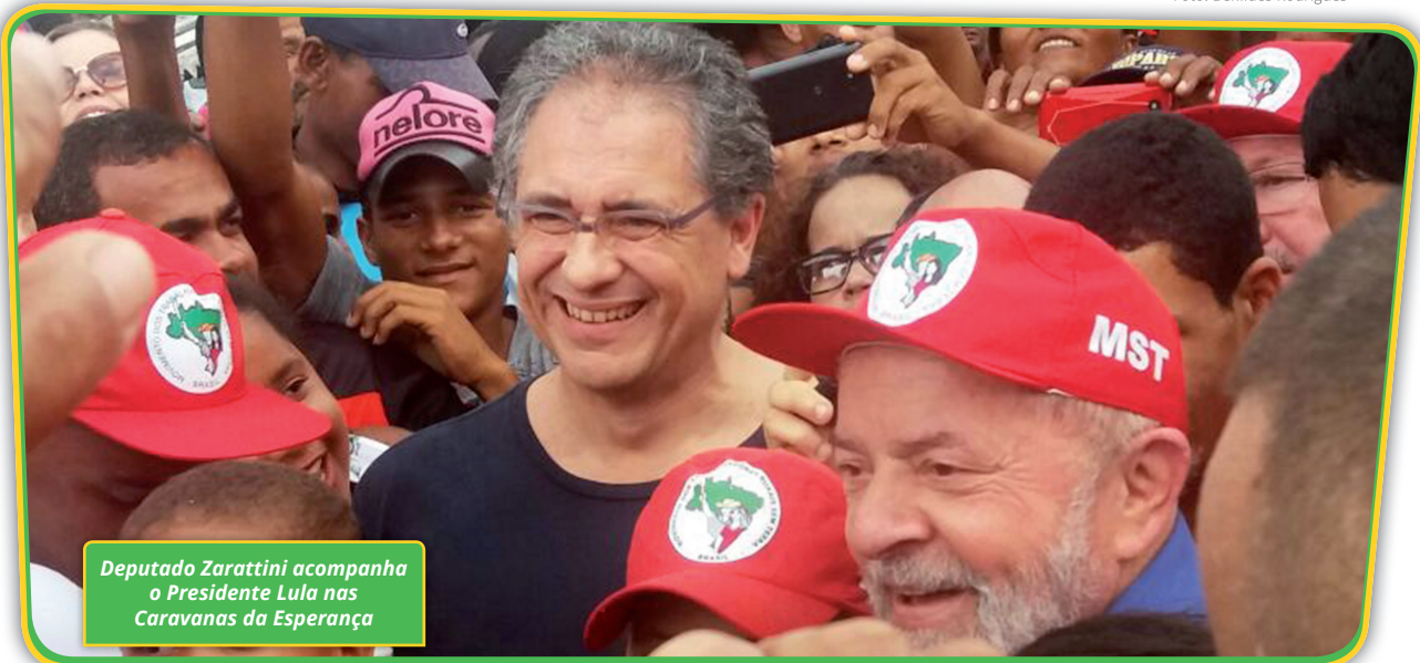
Deputado Zarattini acompanha o Presidente Lula nas Caravanas da Esperança

Em 2017, Lula iniciou as caravanas e mobilizou o Brasil. Foi ao Nordeste, Minas Gerais, Rio de Janeiro, Rio Grande do Sul, Paraná e Santa Catarina. Percorreu todos esses Estados e mobilizou o povo brasileiro, mostrando que nós poderíamos ter de volta um governo democrático e popular. Um governo que ouvisse o povo, que desse atenção as suas demandas e que combatesse a miséria e a desigualdade.